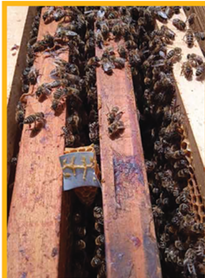
Slika 2. Devet izvučenih matičnjaka od dvanaest postavljenih pozicija u stadiju jajašca. Uzgoj je namjerno proveden u „nepovoljnim” uvjetima, to jest bez dodatnog stresanja mladih pčela iz pomoćne zajednice s ciljem pojačavanja obezmatičene zajednice, bez dodavanja pogače i bez prihranjivanja. Spareno je osam matica, pokazalo se odličnih.

Pčelinja zajednica mora imati barem dva nastavka puna pčela i legla. Pčelinju zajednicu, na primjer, u petak popodne podijelimo tako da u donjem nastavku ostane matica na zatečenom okviru, u pravilu s otvorenim leglom, a ostale okvire s leglom smještamo u gornji nastavak. Između nastavaka umećemo matičnu rešetku s letom. Cilj ovog zahvata je privući u gornji nastavak maksimalan broj pčela u raznim razvojnim stadijima, te postići da u trenutku umetanja jajašca ili larvi ne bude otvorenog legla iz kojega bi