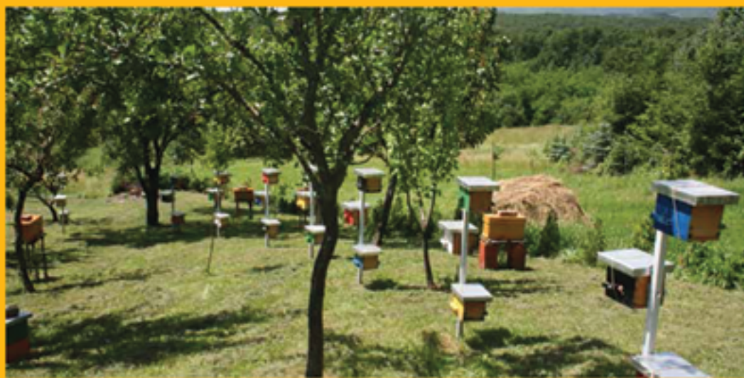
Matice možete staviti u oplodnjak ili odmah u novu zajednicu

s jednim do dva litra rastvora meda i mlijeka u odnosu 1 : 1. Obezmatičena zajednica takav će rastvor konzumirati tokom noći. Paralelno sa vađenjem trake sa uzgojnim materijalom i vađenjem jednog okvira iz obezmatičene zajednice, radi oslobađanja prostora za smještaj okvira s matičnjacima, korisno je u oslobođeni prostor natresti pčela sa dva-tri okvira s otvorenim leglom (bez matice) iz pomoćnih zajednica. Ne zaboravimo da se