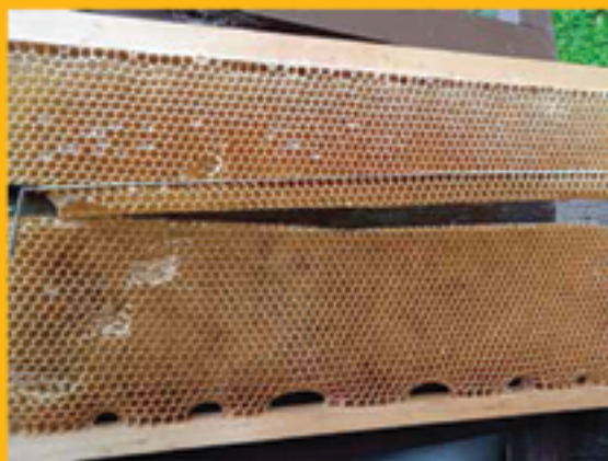
Slika 4. Proizvodnja većeg broja matičnjaka

Četvrti vikend – priprema nukleusa/oplodnjaka, izrezivanje matičnjaka i njihovo umetanje u košnicu