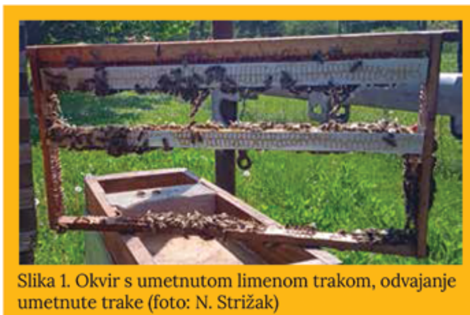
Slika 1. Okvir s umetnutom limenom trakom, odvajanje umetnute trake

vještačke stanice (Jenterov postupak), a zbog čega nijesu potrebna ulaganja u pomagala za ove postupke. U saću, u kojem matica još nije zalijegala, skalpelom se napravi rez kroz sredinu reda stanica saća, te se u tako nastali prorez utisne traka tankog lima. Time je okvir pripremljen za zalijeganje (Slika 1). Limena traka je uža od širine saća (njezina širina iznosi od 18 do 20 milimetara, a debljina oko 0,3 milimetara), no duža je oko 40 milimetara od okvira kojim pčelarimo. Prije umetanja u okvir, produženi dio trake se savije na ivicama, pod uglom od 90°, radi njezina pričvršćenja na bočne letvice okvira pri kasnijoj ugradnji u okvir koji nosi matičnjake. Tako umetnutu traku pčele brzo povežu prihvatnim stanicama s ostalim stanicama saća, a matica najčešće u potpunosti zanese već prvi niz radiličkih stanica uz nju. U praksi limena traka nimalo ne remeti strukturu legla ni ponašanje matice i pčela. Važno je naglasiti da se traka ugrađuje u saće koje nije bilo zaleženo. Naime, jajašce se pri vještačkom uzgoju nalazi u radiličkoj stanici koju pčele pregrade u matičnu stanicu. Ako nam treba veća količina matičnjaka, u isti se okvir može ugraditi više traka za nekoliko uzgojnih zajednica. Pri proizvodnji matica za vlastite potrebe, najjednostavnije je za proizvodnju