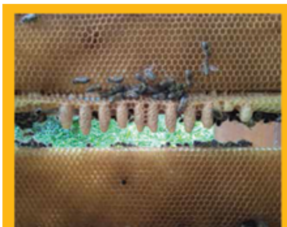
Slika 3. Umetanje matičnjaka u nukleus

Provjeravamo broj kvalitetno izvučenih matičnjaka radi plana formiranja nukleusa/oplodnjaka. Ako ih provjeravamo u nedjelju, matičnjaci su stari osam-devet dana, te su zatvoreni ili gotovo zatvoreni (Slika 2). Prema broju kvalitetno izvučenih matičnjaka znamo koliko nukleusa/oplodnjaka valja pripremiti. U trenutku utvrđivanja broja prihvaćenih matičnjaka, uzgojna se zajednica može vratiti u prvobitno stanje, to jest možemo skloniti poklopac koji razdvaja zajednicu, no i dalje ostavljamo matičnu rešetku. Naime, pčele neće uništiti već prihvaćene matičnjake, premda osjećaju maticu u donjem nastavku.